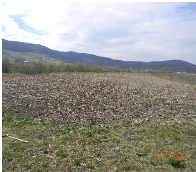
Fig nr. 3 Amplasament platformă intrare foraj (entry point) mal drept r. Șieu