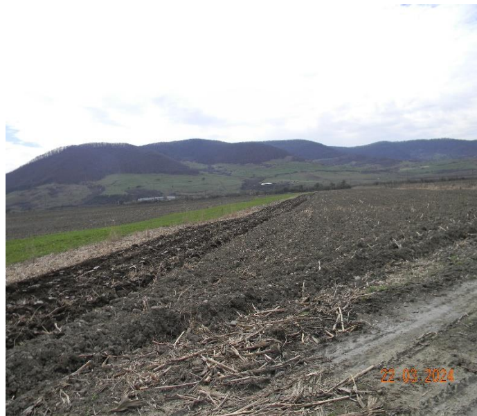
Fig nr. 4 Amplasament platformă ieșire foraj (exit point) mal stâng r. Șieu

Informațiile privind prezența și efectivele/suprafețele acoperite de specii și habitate de interes comunitar în zona proiectului propus este prezentată în tabelul de mai jos.